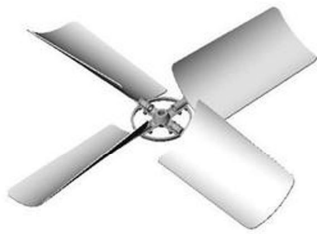
Fan blade (air hole)