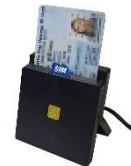
Thai ID Smart Card Reader

เครื่องอ่านบัตรประชาชนไทยสมาร์ทการ์ด สามารถอ่านบัตรประชาชนสมาร์ทการ์ดของกรมการปกครองได้ทุกรุ่น