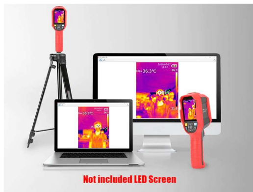
ต่อกับจอมอร์นิเตอร์ได้