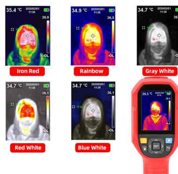
เลือกสีภาพความร้อนได้ 5 แบบ