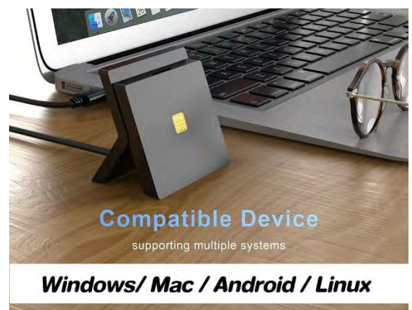
รองรับ Win, Mac, Android, Linux