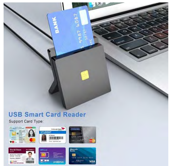
รองรับบัตรสมาร์ทการ์ดหลายประเภท